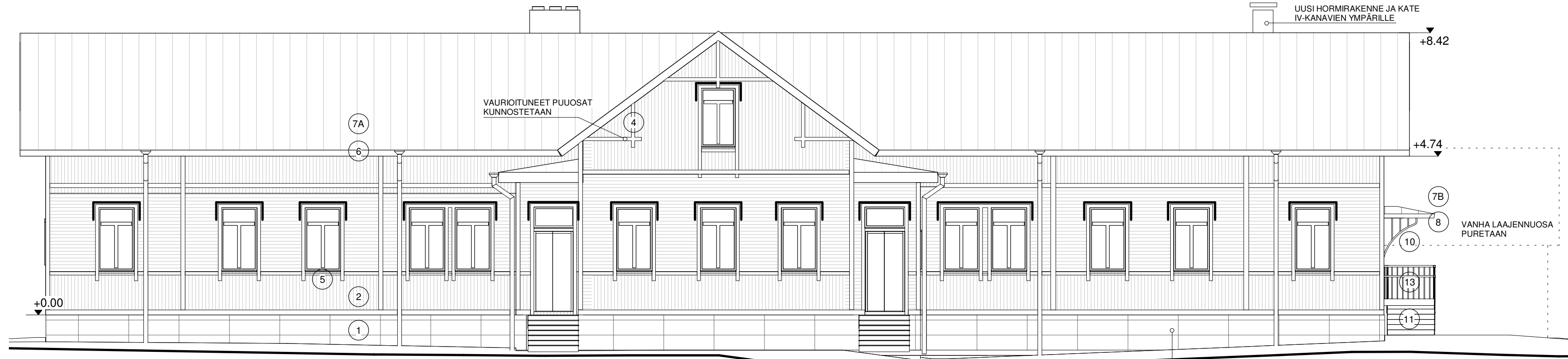
JULKISIVU ETELÄÄN 1:100

LISÄTÄÄN TUULETUSAUKKOJA (RU) VARUSTUS RITILÄLLÄ LAAJUUS RAK. SUUN. MUKAAN