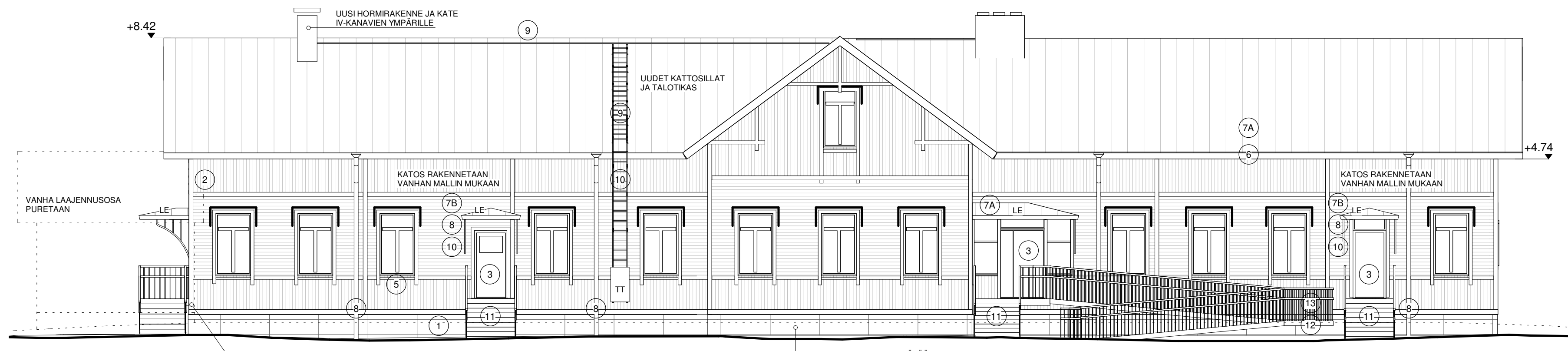
JULKISIVU POHJOISEEN 1:100

JULKISIVU KUNNOSTETAAN LAAJENNUSOSAN TAKAA ALKUPERÄISTÄ MUKAILLEN